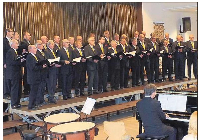
Der Männergesangverein besteht seit 160 Jahren und ist Gastgeber des Chorfests am 29. April.

Abendmahl; Ostersonntag 10 Uhr Gottesdienst mit Abendmahl. Dinker, St. Othmar: Karfreitag 17 Uhr ökumenischer Kreuzweg von Dinker nach Welper; Oster- sonntag 5.30 Uhr Feier der Oster- nacht; Ostermontag 10 Uhr Got- tesdienst. Herzfeld, Dankeska- pelle: 10.30 Uhr Karfreitag Got- tesdienst mit Abendmahl, an- schließend Kirchencafé. Weslarn, St. Urbanus: Karfreitag 15 Uhr Andacht zur Sterbestunde Chri- sti; Samstag 22 Uhr Osternacht; 10.30 Uhr Familiengottesdienst; Montag 10.30 Uhr Gottesdienst für die Region in St. Pantaleon Lohne.