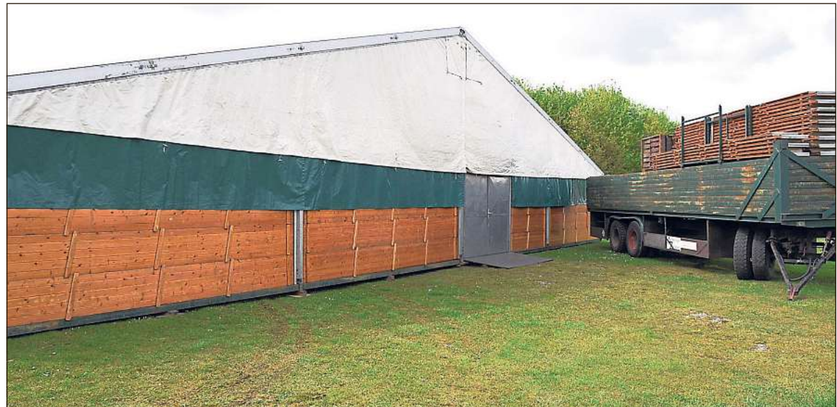
Am Bürgerhaus in Herzfeld sind bereits die Zelte für die Gewerbeschau am kommenden Wochenende auf- gebaut.

Lippetal-Lippborg (gl). Die Konfirmationsfeier in der Evangelischen Kirchengemeinde Dinker findet am Sonntag, 30. April, statt. Be- ginn des Gottesdienstes ist um 10 Uhr in der St.-Othmar-Kir- che. Mehr als 20 Konfirmanden unter anderem aus Lippborg stehen bei der Feier im Mittel- punkt.