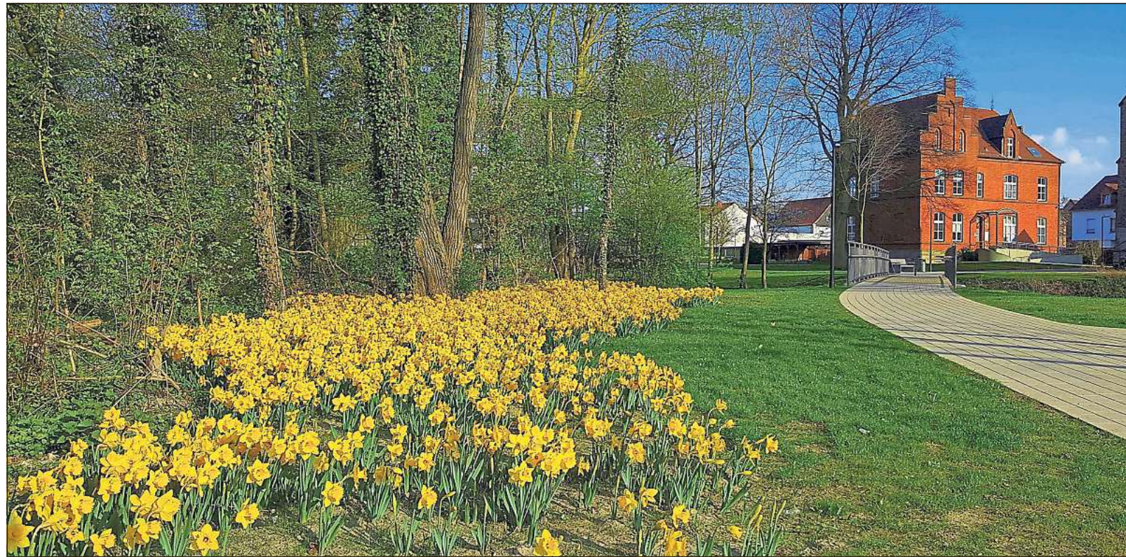
Der Kirchplatz in Lippborg ist an diesem Wochenende ein Ort, an dem die Osterglocken sowohl sprießen als auch läuten.

Rathaus nennt zwei Beispiele: „In diesem Jahr sind erstmals unsere Versorger „Unitymedia“ und „Innogy“ mit von der Partie. Sie werden auf der Ausstellung mit speziellen Infomobilen vor Ort sein und über ihr breites Leistungsspektrum informieren.“